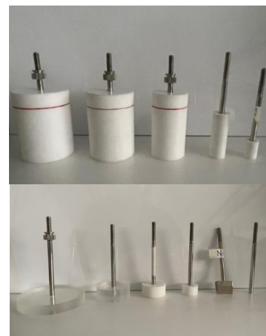
食感プロファイル試験用治具