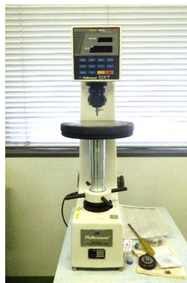
ロックウェル硬さ計