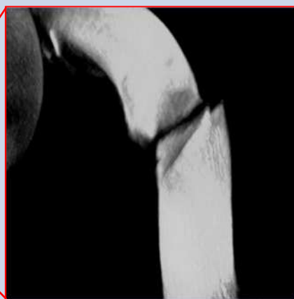
電子基板の断線(CT画像)